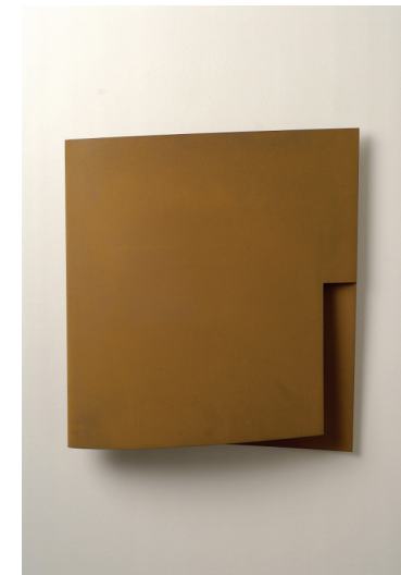
Ohne Titel, 2006 Cortenstahl 54 x 48 x 10 cm