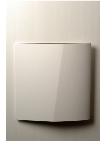
Ohne Titel, 2007 Lack auf Aluminium 20 x 17 x 4 cm